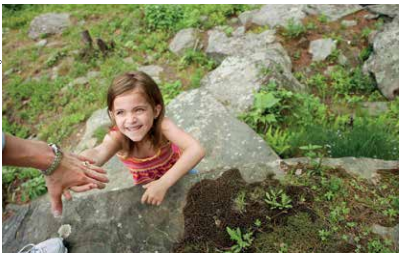
Barn tycker ofta att de visar att de behöver stöd.

stödet. De vuxna och barn som ingår i Uppsala-studien får man kontakt med bland annat via socialtjänsterna och stödverksamhet i länet men också via brukarorganisationer. Förhoppningen är